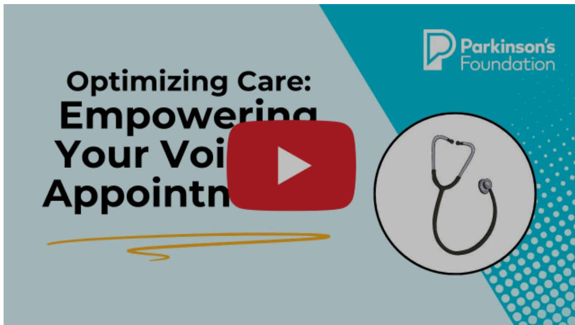
VIDEO DE OPTIMIZACIÓN DE LA ATENCIÓN